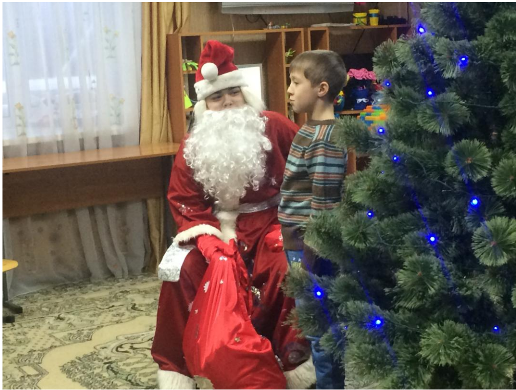
Новогоднее поздравление гимназистов для воспитанников социального приюта с.Калтасы.