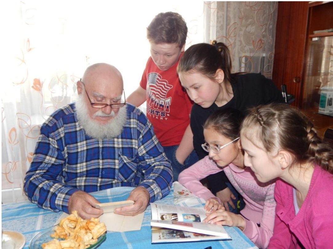
Посещение ветеранов Великой Отечественной войны