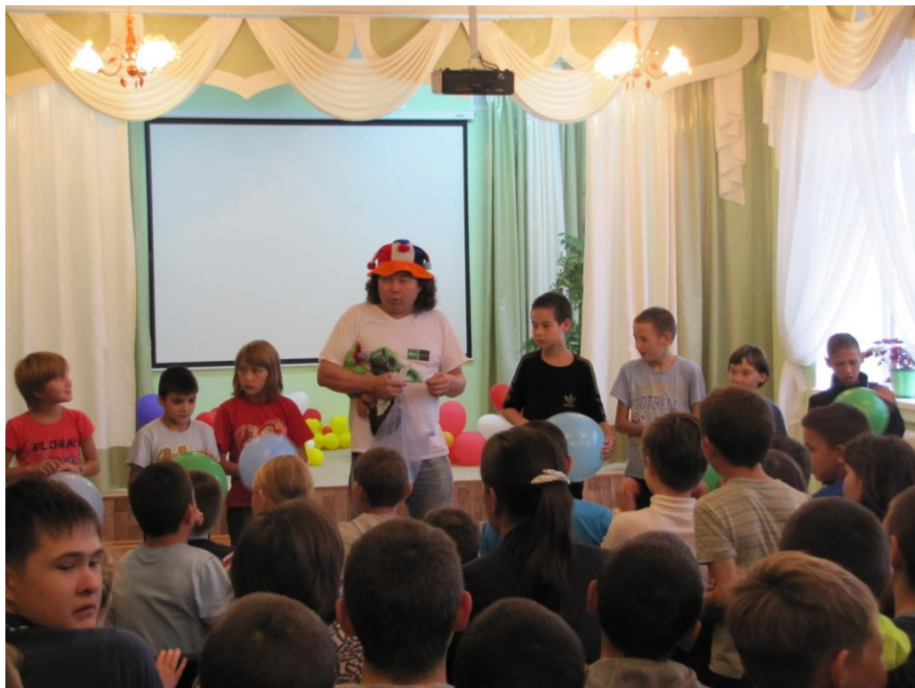
Гимназисты на встрече Акселя Гросса с воспитанниками школы-интерната