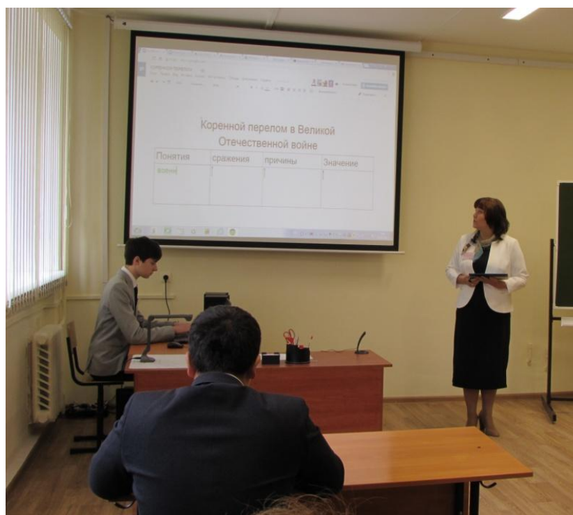
Использование виртуальной обучающей среды Moodle.

2016 год Призёр всероссийского конкурса на лучший опыт образовательной организации по выявлению, сопровождению развития одарённых детей «Одарённый школьник».